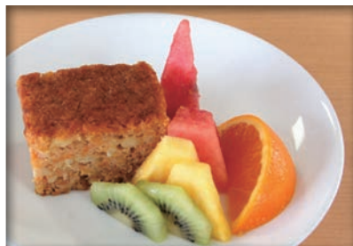
食欲の秋にヘルシーなデザートを