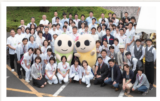
2017年の健康祭。杉並区のゆるキャラと一緒に