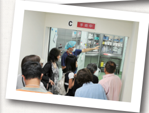
上：講演会 下：院内ツアー